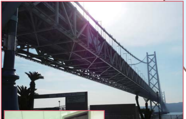
▼景色をゆっくりと眺めることができる「展望ラウンジ」

◆神戸市垂水区東舞子町2051 ◆TEL:078-785-5090/FAX:078-785-5109 ◆営:9:30~18:00(入館は閉館30分前まで)/GW・夏休み9:30~19:00(入館は閉館30分前まで) ◆定:第2月曜日(祝日の場合は翌日)12月29日~12月31日/GW・夏休みは無休◆アクセス:JR舞子駅(EVあり)または山陽電鉄舞子公園駅(EVあり)より南へ徒歩約5分◆入館料:大人平日240円 土・日・祝300円/高校生・高齢者(年齢を確認できるものを提示)平日120円 土・日・祝150円/小・中学生以下無料/障がい者(要手帳提示)/3館共通入場券あり720円(孫文記念館(移情閣)/舞子海上プロムナード/橋の科学館) ◆HP: http://www.hyogo-park.or.jp ※4月以降の料金については要問い合わせ