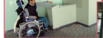
▲高さ約300mの大橋の主塔からの景色を操作してズームイン!『展望カメラシステム』