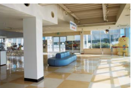
▲「くつろぎのスペース(無料休憩コーナー)」では、明石海峡大橋を眺めながらゆっくりと過ごせますよ!