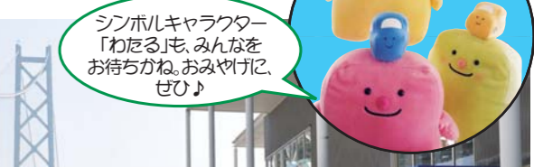
シンボルキャラクター「わたる」も、みんなをお待ちかね。おみやげに、ぜひ!