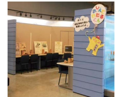
▲「ちびっ子コーナー」では、パソコンを使ってクイズに挑戦!木のブロックを組み合わせ楽しみながら学習しよう