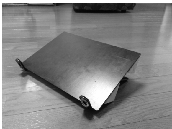
パソコン台のみの図

皆さまこんにちは。今号は自助具の特集ということで、私が長年使っている「パソコン台」を紹介いたします。自助具と聞いてまず思い浮かぶのは、手に装具を取り付けて文字を書いたり、フォークやスプーンで食事をする、と考える方が多いのではないのでしょうか。私の場合はオーバーテーブル上でパソコン作業を行うのですが、両手が使えないので、口に“マウススティック”と呼ばれる棒をくわえてキーボードを打ちます。キーボードを打つ際に、角度を付け打ち易くするためにパソコン台を使用しています。このパソコン台ですが、ホームセンターで材料を入手することが出来て、簡単に作ることが出来ます。簡単に作ることが出来ても、強度は大丈夫なの？すぐに壊れるのでは？と思われるかもしれませんが、私自身が10年使っていて、現在もまだまだ現役です。材料は、「塩ビ板」「金属ステー」「三角形の木材」「椅子脚用クッション」「両面テープ」。私自身がホームセンターで材料を選び、パソコン台の完成した姿をイメージしながら、父と作りました。角度や高さは意外と私の車椅子使用時の高さに合いました。このパソコン台は車椅子上でも使用出来るのですが、ベッドをギャッジアップしてベッド上の座位の状態でも使用出来るので、重宝しています。興味のある方は連絡して下さい、詳しい作り方の説明をさせていただきます。