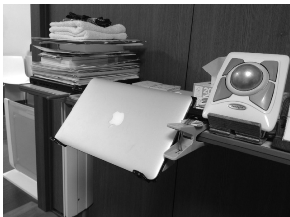
パソコン取り付け図