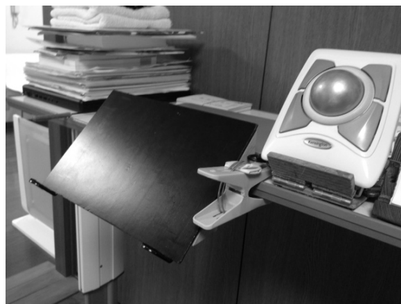
パソコン台取り付け図