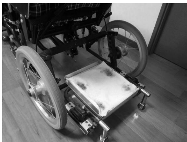
手動型車椅子 呼吸器台