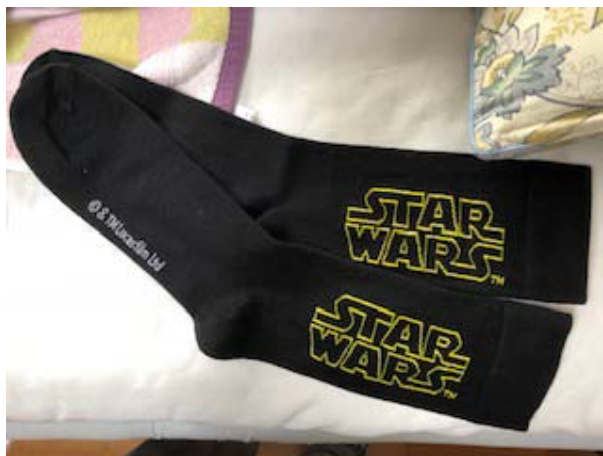
STAR WARS ソックス 2 足で ¥898 円 他で目に付いたのがミッキーマウスの柄が入っ

まず目に入ったのが「STAR WARS」の柄がある靴下です。色違いも購入しました。足下は隠れてしまうので見えない所も気を付けしました。(下)