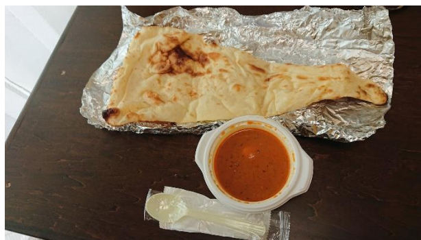
ナンカレーのセット

今回はテイクアウトのできる店としてインド・ネパール料理の「ナマステ・ガネーシャマハル」を紹介しました。神戸にはインドの人が多く在住していることもあり、インド料理の店が数多くあります。神戸を訪れた時には是非いろいろな店を利用して、自分のお気に入りの店を探してみるのはいかがでしょうか?